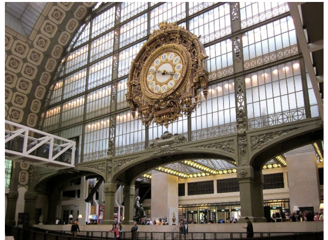
Musee d'Orsay

Im Rahmen einer Führung besichtigen Sie am Vormittag die Bibliothèque Mazarine im Collège des Quatre Nations , das unmittelbar am Seineufer liegt. Den Grundstock der Büchersammlung legte Kardinal Mazarin, der einflussreiche Berater von König Ludwig XIV. Seit mehr als 200 Jahren ist die älteste öffentliche Bibliothek Frankreichs Teil des renommierten Institut de France. In Ihrem Bestand befinden sich mehr als 600 000 Werke vom Mittelalter bis zum 18. Jh., darunter wertvolle Handschriften, Inkunabeln und ein seltenes Exemplar der Gutenberg-Bibel.