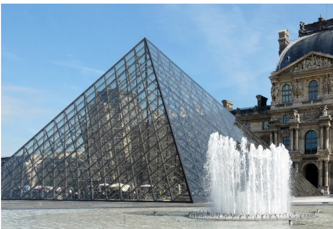
Glaspyramide am Louvre

Vorbei an der Börse erreichen Sie den Louvre in dem sich eines der berühmtesten Museen der Welt befindet. Ein Glanzlicht moderner Architektur ist der Eingangsbereich mit der berühmten Glaspyramide des chinesischen Architekten Ieoh Ming Pei, die heute zu den bekanntesten Wahrzeichen der Stadt zählt (Außenbesichtigungen).