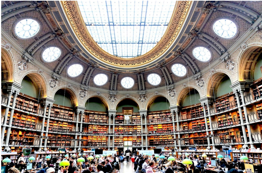
Bibliothèque National de France

Für viele gehört Frankreichs lebhafteste Hauptstadt zu den schönsten und beliebtesten Metropolen der Welt , die faszinierenden Bilder der Olympischen Sommerspiele 2024 haben das eindrucksvoll bestätigt. Auf Schritt und Tritt begegnen sich Tradition und Moderne , treffen weltbekannte historische Gebäude auf Meisterwerke zeitgenössischer Architektur. Dort, wo die französische Sprache entstand und die großen Kapitel einer bewegten Geschichte geschrieben wurden, schlägt bis heute das Herz einer stolzen Kulturnation .