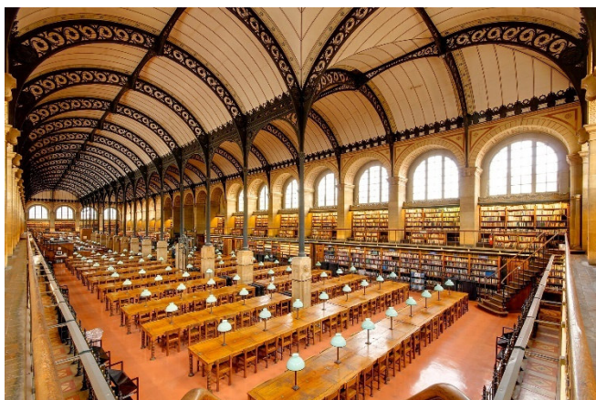
Bibliothèque Sainte-Geneviève