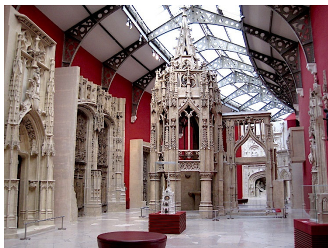
Cité de l'Architecture et du Patrimoine

Der Rest des Tages steht zur freien Verfügung und bietet die Gelegenheit zum individuellen Abendessen.